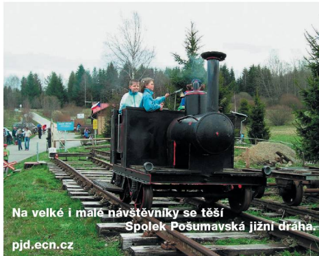
Na velké i malé návštěvníky se těší Spolek Pošumavská jižní dráha. pjd.ecn.cz

Několik kroků od zastávky ČD Nové Údolí najdete v historickém vagónu muzeum pošumavských lokálek a bývalé obce Nové Údolí, plné unikátních cobyových dokumentů. Poté se můžete svést replikou parní lokomotivy Gigant nebo šlapací drezínou Kakadu po 105 metřů dlouhé trati přes hranice do sousedního Bavorska a obdržet pamětní razítko. Vstupné i jízdné je dobrovolné.